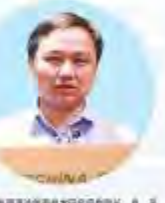
中国能源研究会副理事长兼秘书长 王 平