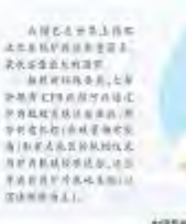
中国能源研究会副理事长兼秘书长 王 平