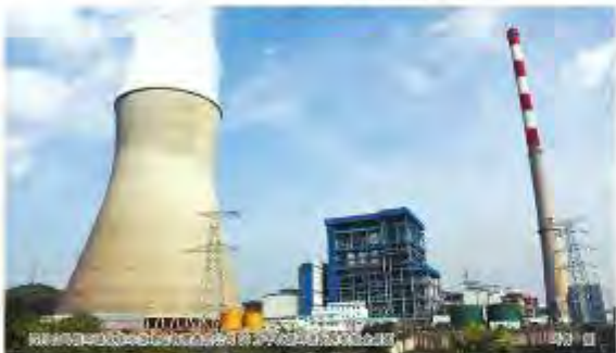
循环流化床发电技术迈进新时代

“循环流化床发电技术是我国特有的产业优势,也是我国节能减排及发展新能源的重要途径。党的十八大以来,党中央高度重视循环流化床发电技术,多次召开专题会议,研究部署循环流化床发电技术,推动循环流化床发电技术高质量发展。”