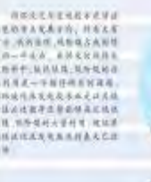
中国能源研究会副理事长兼秘书长 王 平