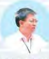
中国能源研究会副理事长兼秘书长 王 平