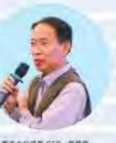
中国能源研究会副理事长兼秘书长 王 平